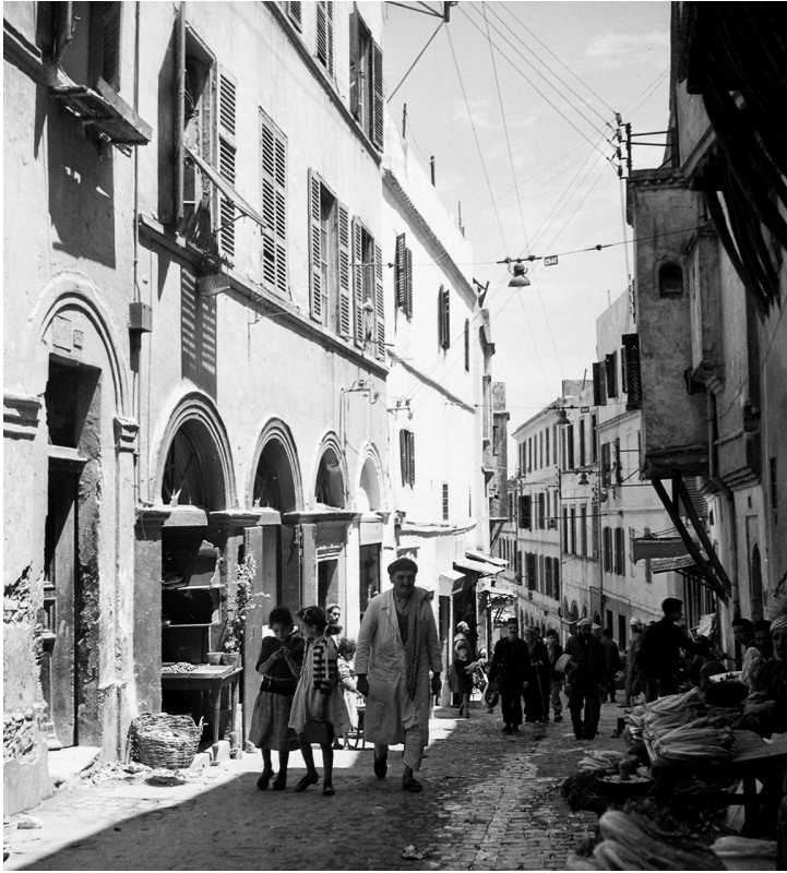
Kasbah von Algier Anfang/Mitte des 20. Jahrhunderts

Über dem Altar der Basilika Notre Dame d'Afrique in Algier steht geschrieben: „Maria bitte für uns und für die Muslime“. Die Basilika wird häufig von Muslimen besucht, die ihre Atmosphäre schätzen. Auch im Islam wird Maria – Meriem – als Mutter des Propheten Aissa (Jesus) verehrt. Die Basilika thront auf dem schönsten Platz der Stadt, hoch über dem Mittelmeer. 1872 war sie von Monsignore Lavigerie, dem Gründer der Wei-